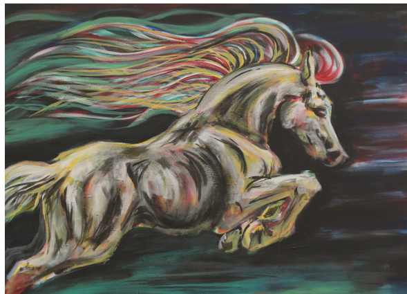
Viivi Honkimaa: Loikka , 2020